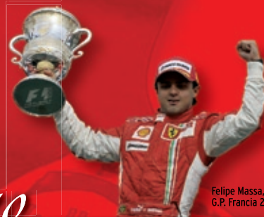
Felipe Massa, G.P. Francia 2008

11° Ritrovo Internazionale di auto e appassionati Ferrari